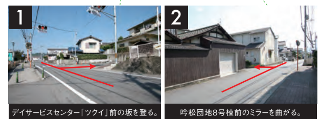
1 デイサービスセンター「ツクイ」前の坂を登る。 2 吟松団地8号棟前のミラーを曲がる。