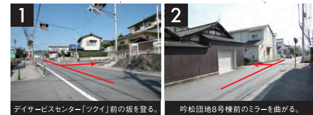
1 デイサービスセンター「ツクイ」前の坂を登る。