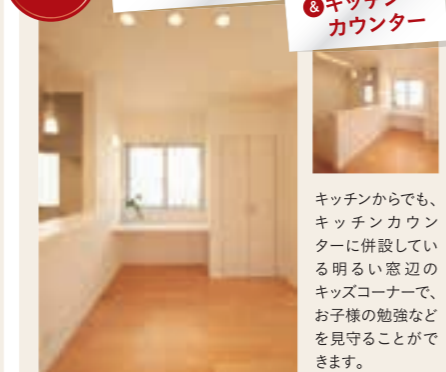
キッチンカウンター

キッチンからでも、キッチンカウンターに併設している明るい窓辺のキッズコーナーで、お子様の勉強などを見守ることができます。