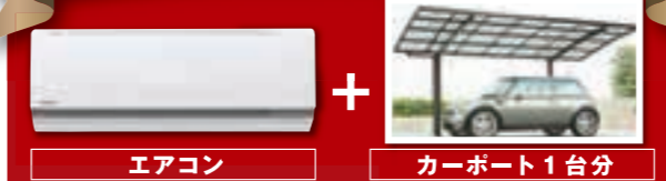
エアコン + カーポート1台分