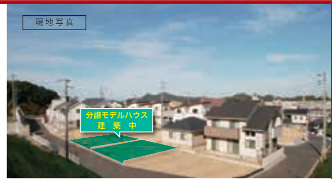
分譲モデルハウス 建築中 8月末完成予定